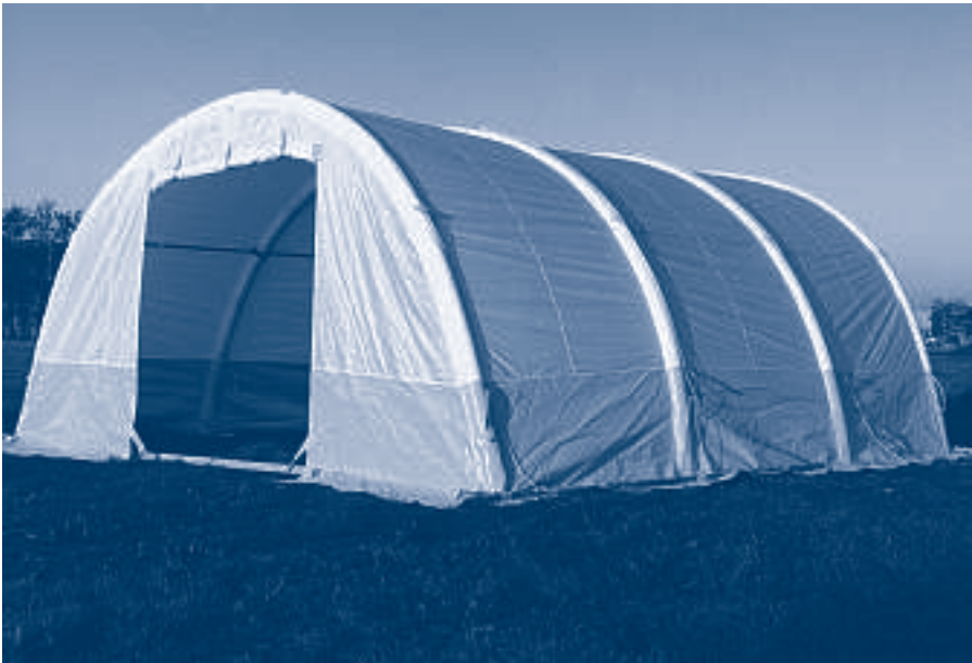
Overkapping voor GWW-projecten

De steigers ervan worden met dubbelzijdige zeilen, die voorzien zijn van isolerend materiaal, afgedekt. Het dak bestaat uit een constructie voorzien van stalen dakplaten.