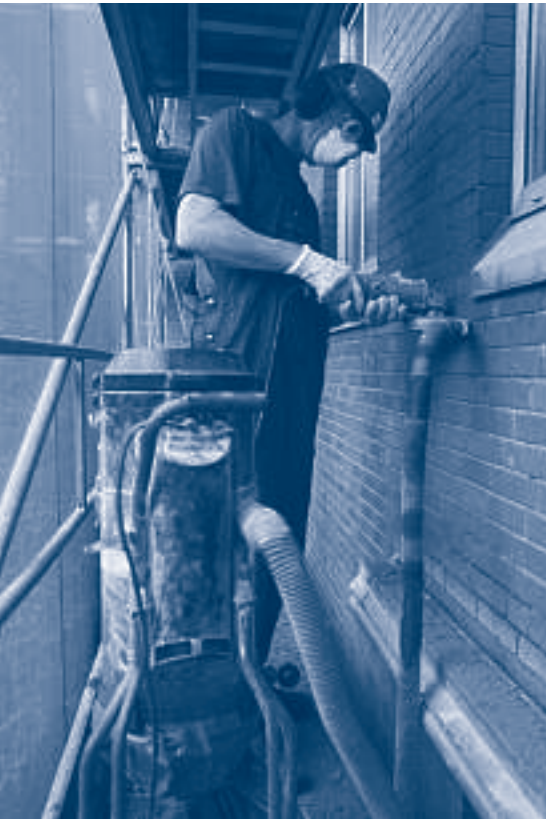
Het uitslijpen van voegen achter afscherming

Kwartsstof ontstaat bij het bewerken van steenachtige materialen.