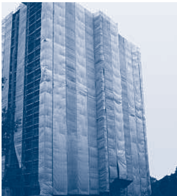
Een afgeschermd steiger