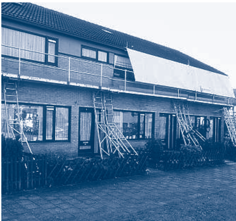
Makkelijk verplaatsbare schermen

In veel gevallen wordt het afschermmateriaal bevestigd aan de werksteiger. Bij werkzaamheden aan galerijflats wordt de afscherming vaak bevestigd aan de balustrades.